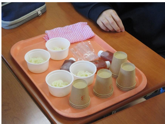
← 色々な希釈倍率の 「めんつゆ」の試食セット