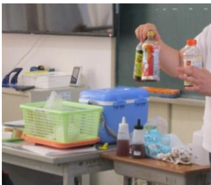
← 試食用の市販めんつゆ